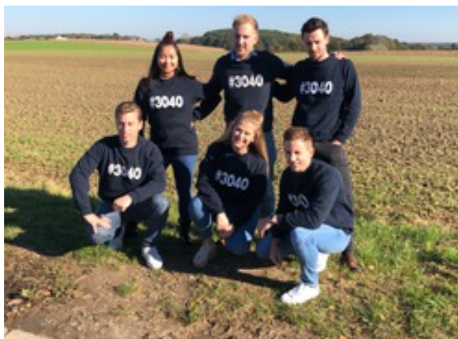
#3040 exclusief bij Jong VLD

Met Bertem, Overijse, Hoeilaart en Tervuren bereikten we een nieuwe samenwerking om de banden te versterken. Door onze ervaringen en expertise uit te wisselen kunnen we elkaar inspireren. Dit leidde tot een bezoekdag met onze leden en geïnteresseerden voor een rondleiding op een Matexi woonproject. Dit project focust op de woondroom van jongvolwassenen. Lokaal en betaalbaar wonen is namelijk één van de prioriteiten waar we samen op focussen. In het voorjaar van 2022 werken we netwerk-en-afterwork-evenement uit, 'Blue Thursday' genaamd. Hou onze sociale media in de gaten voor het nieuws, heet van de naald.