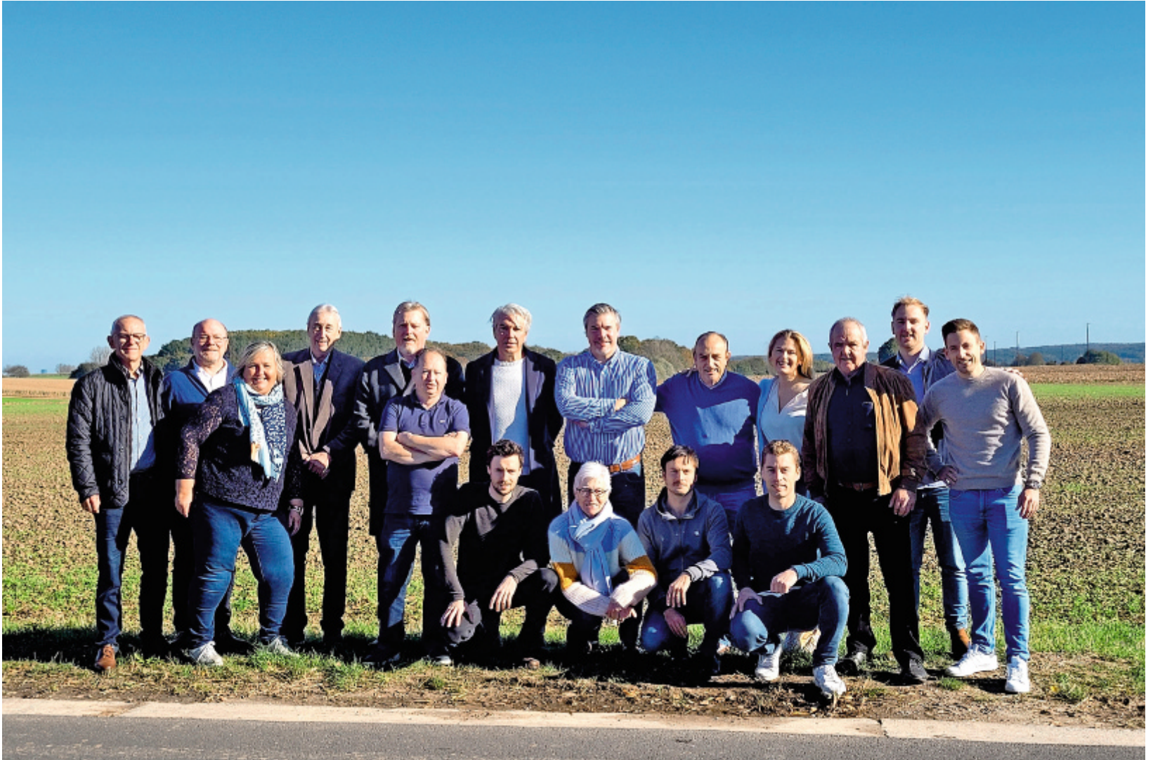
Het Open Vld bestuur: geëngageerd voor Huldenberg