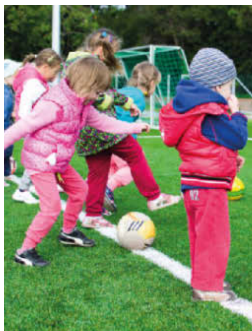
Kleuters sporten op het voetbalveld

Al geruime tijd gaf het gemeentebestuur opdracht om naar een locatie te zoeken voor een nieuw sportcomplex. Heel in het begin, voor de regiovorming decretaal in voege kwam, was dit nog een locatie voor sport, een containerpark en een gemeentelijke loods. Door het toevoegen van Overijse en Hoeilaart aan onze regio verschoof de locatie voor een containerpark uit Huldenberg. De locatiezoektocht werd dan herleid naar louter sport. Dat we ook nog een gemeentelijke loods willen bouwen staat buiten kijf, gezien we momenteel op drie locaties gehuisvest zijn. Bovendien doen we dit in centrale woonzone. Het