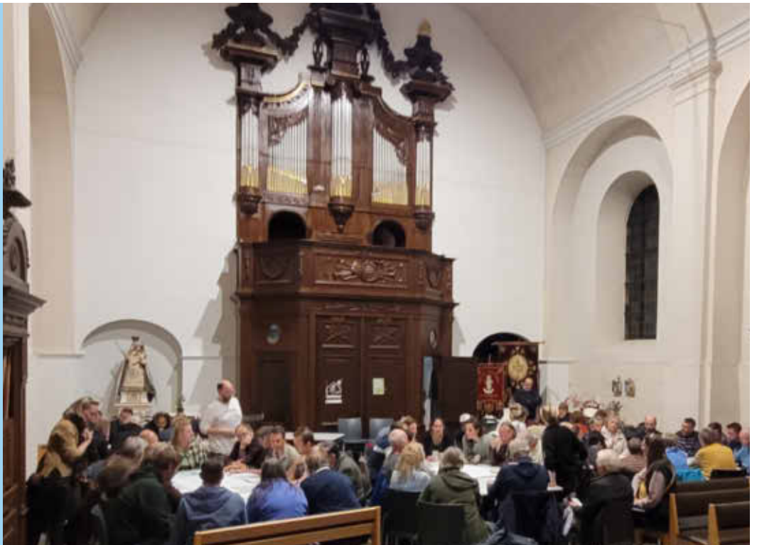
Participatiemoment in de Sint-Niklaaskerk